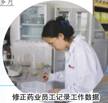
修正药业员工记录工作数据