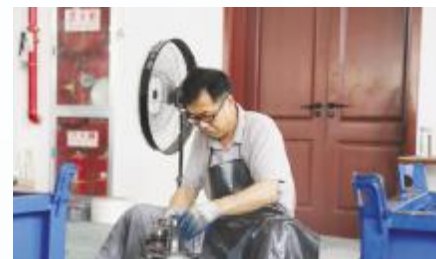
陕西正骏金果机械有限公司的工人正在打磨产品

陕西正骏金果机械有限公司作为城固县智能制造产业园首批入驻企业，总投资5亿元，占地面积30亩。该公司新建机械加工生产线5条，购置数控机床、自动化机床、平面磨等相关生产设备161台（套），生产加工汽车、拖拉机等零部件，主要为一拖集团、陕汽集团、比亚迪、财富集团等企业供应相关配套产品。项目建成后，年消耗金属材料1362吨，加工各种规格机械零件320万件，有较好的市场基础和广泛的营销脉络，项目建成投产后可实现年产值3.5亿元，实现税收2100万元，同时带动500余人就业。