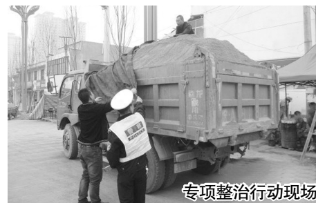
专项整治行动现场

阳光讯 (记者 芮扬 通讯员 韩芳玲 文/图) 12月25日,宝鸡市公安局凤翔分局交通警察大队在辖区开展大气污染防治违法行为专项整治行动。