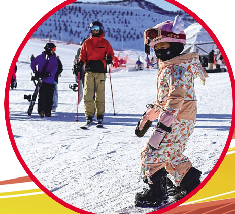
在新疆阿勒泰将军山国际滑雪度假区,一名小朋友在练习滑雪。