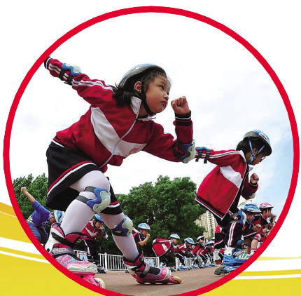
河北省沧州市育红小学的学生在体育课上练习轮滑。

2023年7月29日,观众在比赛结束后涌入赛场(无人机照片)。当日,贵州榕江(三宝侗寨)和美乡村足球超级联赛迎来年度总决赛。