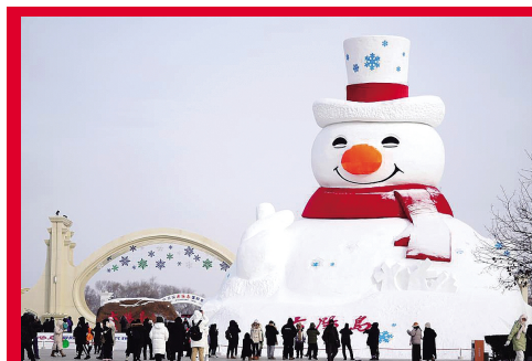
游客在哈尔滨太阳岛雪博会园区游玩