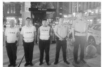
与各实战单位混合编组,协作配合,“点、线、面”三维发力,紧盯重点区

此次清查,警方采取以点带面、集中巡逻、定点检查等多种方式,对辖区内便民市场、门店摊点、夜市等人员密集场所和治安复杂部位进行了重点巡逻。行动中,机关民警辅警