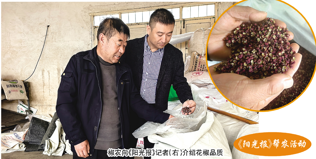
椒农向《阳光报》记者(右)介绍花椒品质

宝鸡市陈仓区赤沙镇3.5万亩花椒一直是当地村民致富增收的“金豆豆”，品种有“大红袍”“秦椒”“凤椒”等。然而，让当地群众引以为豪的花椒还有一万余斤急盼销路，这让椒农们很焦虑。小小花椒是当地群众的生活希望，希望热心人能帮一帮大山里的村民，让他们不再焦虑。